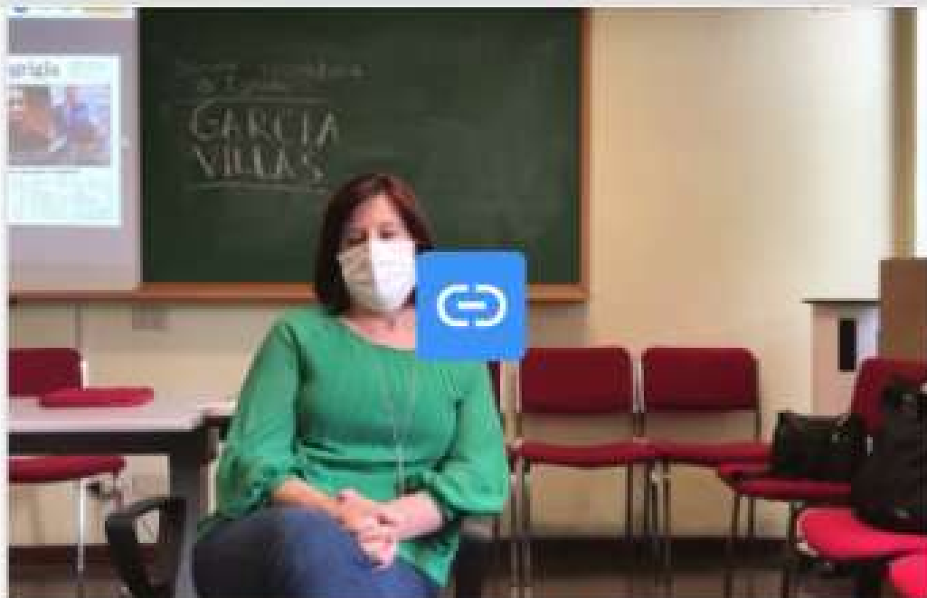
Filmato in versione integrale dell'intervista