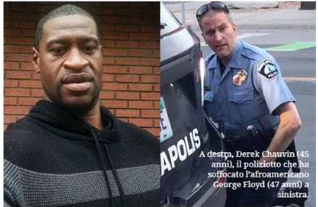
A destra, Derek Chauvin (45 anni), il poliziotto che ha soffocato l'afroamericano George Floyd (47 anni) a sinistra.