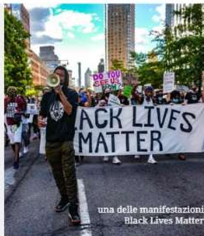
una delle manifestazioni Black Lives Matter