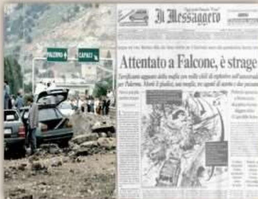
Giovanni Falcone è morto nella strage di Capaci il 23 maggio 1992.