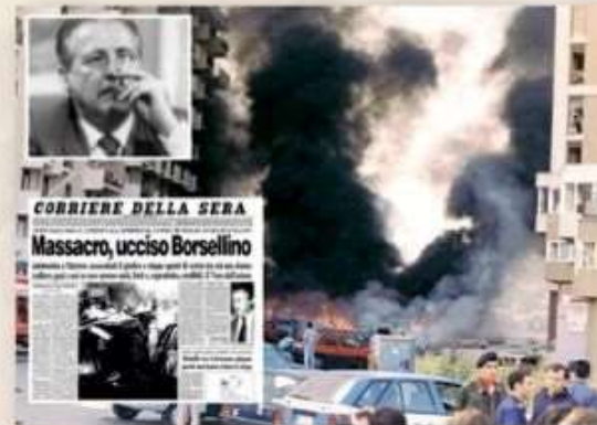
Paolo Borsellino è morto nella strage di Via d'Amelio del 19 luglio del 1992.

Quando si parla di lotta alla mafia, le figure che vengono subito in mente sono quelle di Giovanni Falcone e Paolo Borsellino. I due hanno sacrificato la loro vita per combattere la criminalità organizzata sia come persone che ovviamente come magistrati. Falcone e Borsellino erano uniti nel lavoro, ma oltre l'essere colleghi erano legati anche da una forte amicizia, accomunati da un tragico destino che ha visto la